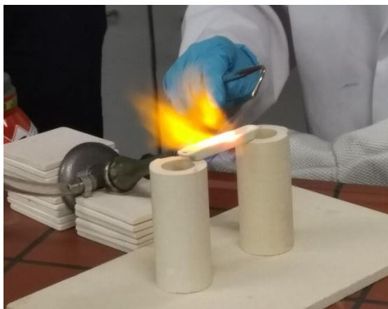
Einschmelzen des Goldstaubs mithilfe eines Wasserstoffbrenner. Der Bunsenbrenner ist als Unterstützung von unten angelegt.