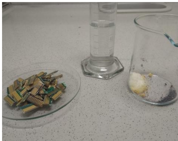
Vorbereitung zur Herstellung der Iod/Iodid Lösung um das Gold im Elektroschrott zu oxidieren und in Lösung zu bringen.